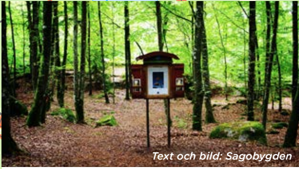
Text och bild: Sagobygden